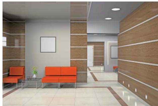
> INSTALAÇÕES PÚBLICAS